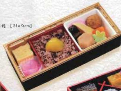
うたげ 宇打 ¥300+税 [21×9cm]