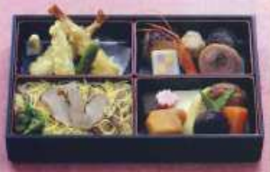
※写真は秋の季節です はな ¥2,500+税 [29.5×18.5cm] (白飯 ¥2,200+税)