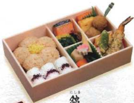
にしき 錦 白飯・茶飯 ¥1,200+税 [23×15cm] (白飯・赤飯 ¥1,400+税 / 赤飯 ¥1,500+税)