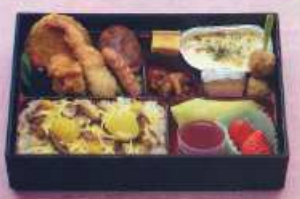
※写真は秋のご飯です こと 琴 ¥2,000+税 [28.5×19.5cm] (白飯 ¥1,700+税)