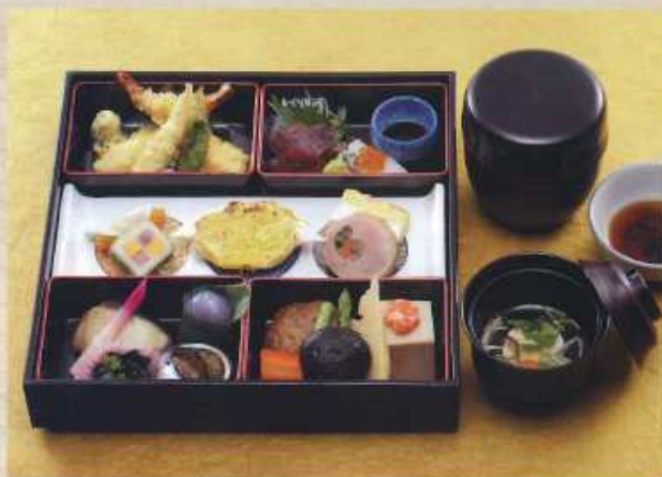
かぼつ 花月 ¥3,500+税 [28×28cm]