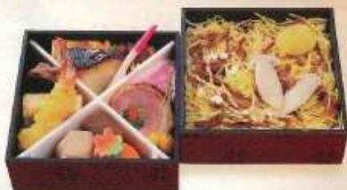
秋の新詰 萩のふきよせ ¥1,500+税 【13.2cm 2折重ね】