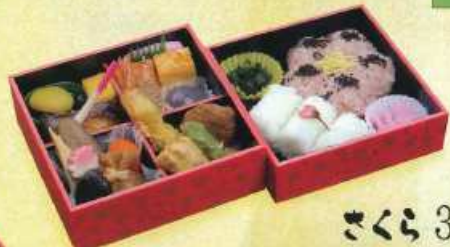
さくら 3 ¥2,000+税 [16×16cm 15×15cm]