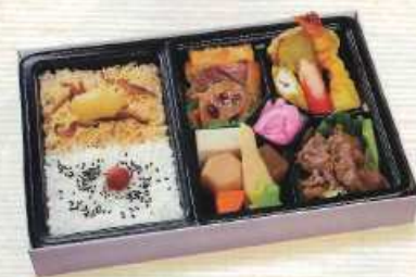
いろご ¥1,200+税 [28×18cm]