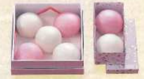
紅白まんじゅう 2個入り ¥1,050+税 [7.2×14.2cm] 5個入り ¥2,250+税 [15.3×15.3cm]