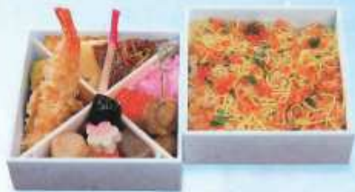
冬の新詰 冬のふきよせ ¥1,500+税 【13.2cm 2折重ね】