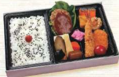
かわら ¥1,000+税 [28×18cm]