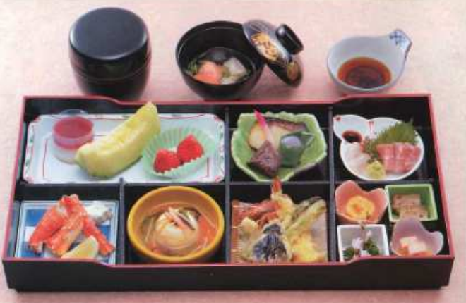
おびき 雅 ¥6,000+税 [50×25.5cm]