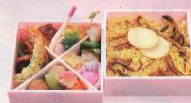
春の新詰 藤のふきよせ ¥1,500+税 【13.2cm 2折重ね】