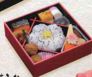
すみれ すみれ ゆかり飯 ¥900+税 [16×16cm] (赤飯 ¥1,000+税)