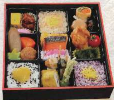
ここのえ 九重 ¥1,200+税 [20×20cm]