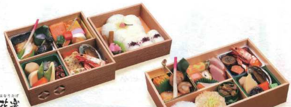
はなうたげ 花博 白飯 ¥4,000+税 [20×20cm 15×15cm] (白飯・赤飯 ¥4,200+税/赤飯 ¥4,300+税)

お祝い、会議、研修会、旅行、各種宴会など、ご用途に合わせてお選びください。 ※赤飯のお値段は、厚切餅、赤飯の厚み、お米の量にも変動があります。