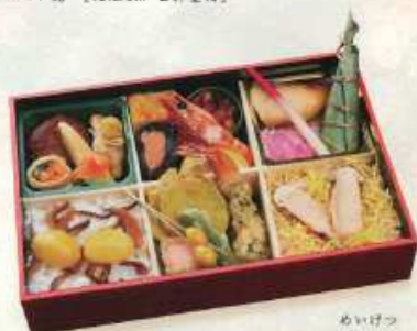
めいげつ 秋の新詰 名月 ¥2,000+税 【25.8×17.3cm】