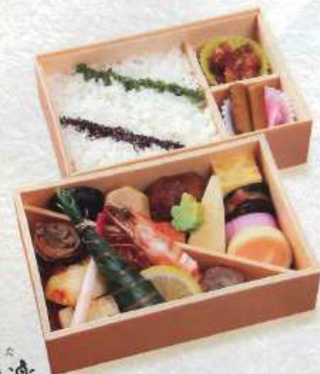
うた 雅楽 ¥2,000+税 [16×12cm 2折重ね]