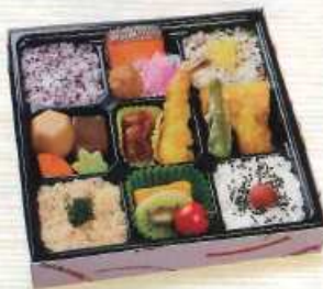
みずほ ¥1,000+税 [22×22cm]