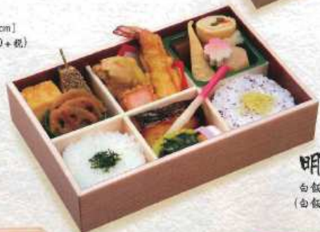
あすか 明日香 白飯・ゆかりご飯 ¥1,200+税 [22.5×15cm] (白飯・赤飯 ¥1,300+税)