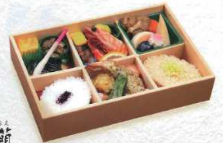
あま 明 白飯・茶飯 ¥2,000+税 [26×17.4cm] (白飯・赤飯 ¥2,100+税/赤飯 ¥2,200+税)