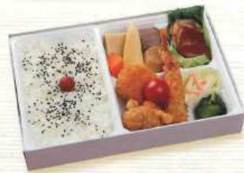
あめめ ¥800+税 [26×16.5cm]