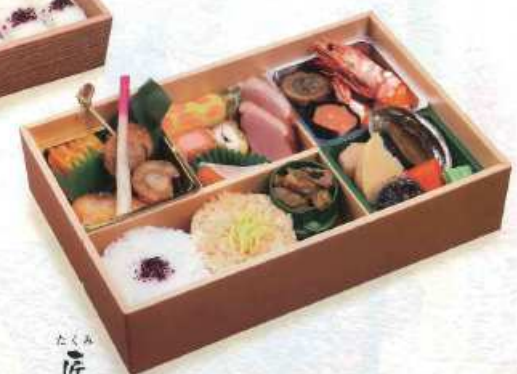
たくみ 匠 白飯・茶飯 ¥3,000+税 [27×18cm] (白飯・赤飯 ¥3,100+税/赤飯 ¥3,200+税)