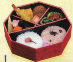
さくら 1 ¥1,000+税 [直径18.5cm]