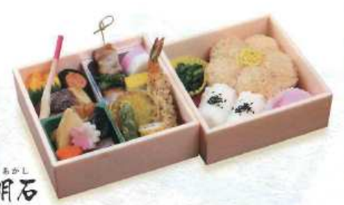
あかし 明石 白飯・茶飯 ¥1,500+税 [15×15cm 14×14cm] (白飯・赤飯 ¥1,700+税/赤飯 ¥1,800+税)