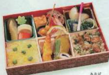
あおば 夏の新詰 青葉 ¥2,000+税 【25.8×17.3cm】