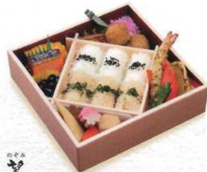
のぞみ 望 白飯・茶飯 ¥1,000+税 [18×18cm] (白飯・赤飯 ¥1,100+税 / 赤飯 ¥1,200+税)