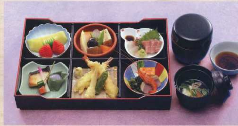
るり 瑠璃 ¥4,000+税 [38×25.5cm]