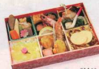
はなまつり 春の新詰 花祭 ¥2,000+税 【25.8×17.3cm】