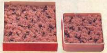
赤飯 大 ¥1,500+税 [18×18cm] 中 ¥1,000+税 [17×17cm] 小 ¥600+税 [13.4×13.4cm]