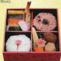
さくら 4 ¥900+税 [16×16cm]