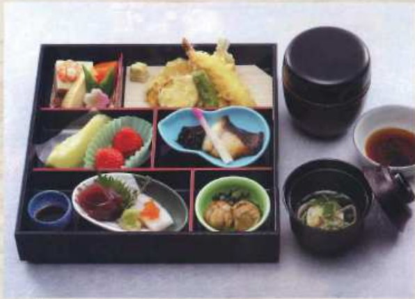
いずみ 泉 ¥3,000+税 [28×28cm]