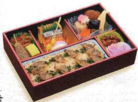
まい 舞 あさりご飯 ¥1,300+税 [23×15cm] (白飯 ¥1,100+税 / 赤飯 ¥1,300+税)

お祝い、会議、研修会、旅行各種会合などご用途に合わせてお選びください。 茶赤飯のお値段で、栗ごはん、あさりご飯にも変更できます。