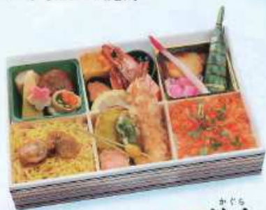
かぐら 冬の新詰 神楽 ¥2,000+税 【25.8×17.3cm】