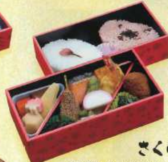
さくら 5 ¥1,200+税 [19×10cm 18×9cm]