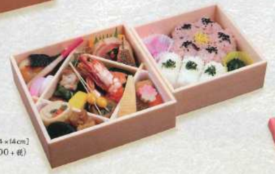
まつかぜ 松風 白飯・赤飯 ¥2,500+税 [17×17cm 14×14cm] (白飯・茶飯 ¥2,300+税/赤飯 ¥2,600+税)