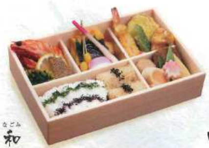
なごみ 和 白飯・茶飯 ¥1,500+税 [24×16cm] (白飯・赤飯 ¥1,600+税/赤飯 ¥1,700+税)