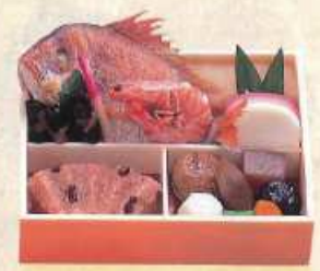
わかたけ 若竹 ¥3,000+税 [24×18cm]

この他の商品もご法事用におつくり可能です。お席での食事が必要な方にお持ち帰り用にお作りして致します。