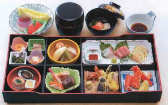
おびき 郷 ¥8,000+税 [50×25.5cm]