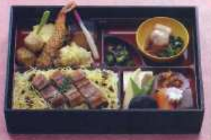
※写真は夏のご飯です てまり 手毬 ¥2,000+税 [28.5×19.5cm] (白飯 ¥1,700+税)