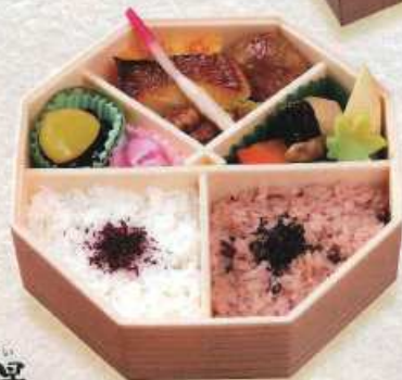
はっけい 八景 ¥1,200+税 [直径18.5cm]