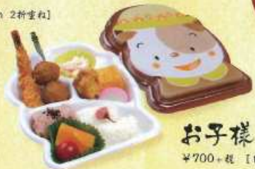
お子様弁当 ¥700+税 [16.5×20.5cm]