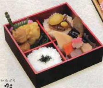
いろどり 彩 白飯・乗ご飯 ¥900+税 [16×16cm] (白飯・赤飯 ¥900+税)