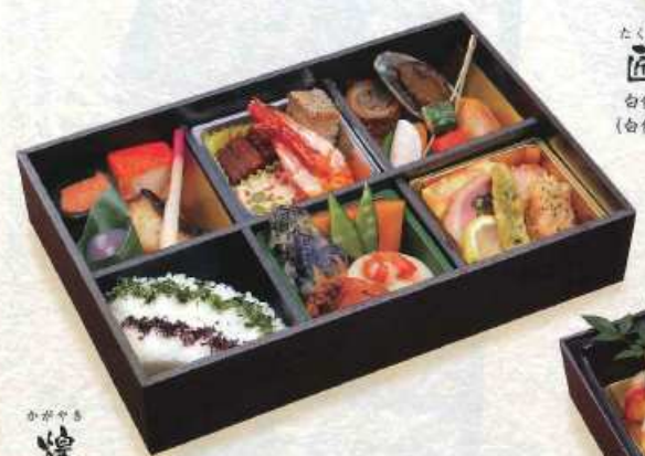
かがやき 煌 白飯 ¥4,000+税 [29×19.5cm] (赤飯 ¥4,100+税)