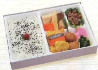
ゆり ¥800+税 [24×16.5cm]