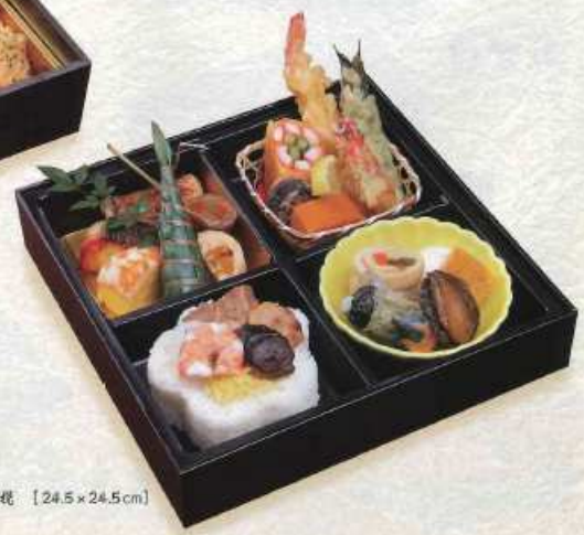
ほうおう 鳳凰 ¥5,000+税 [24.5×24.5cm]