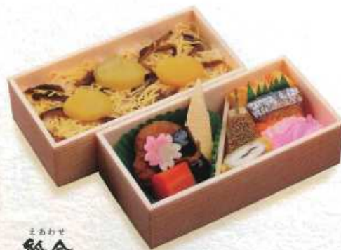
まあせ 総合 乗ごはん ¥1,000+税 [16×8cm 2折重ね] (赤飯 ¥1,000+税)