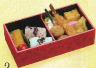
さくら 2 ¥600+税 [19×10cm]

ご卒業ご入学のお祝い、 結婚披露宴の引き出物として、 お祝いのお祝いでご利用ください。