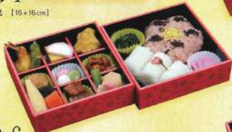
さくら 6 ¥1,500+税 [15×15cm 2折重ね]