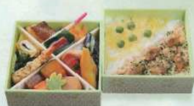
夏の新詰 葵のふきよせ ¥1,500+税 【13.2cm 2折重ね】