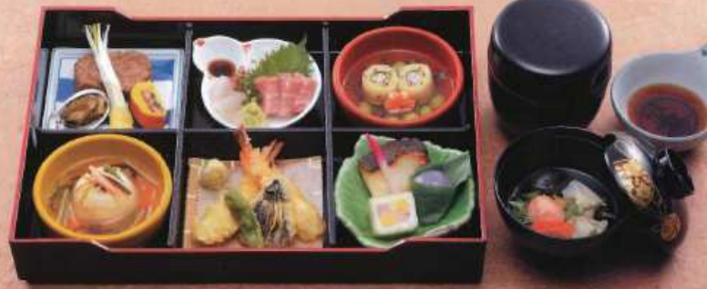
おおき 扇 ¥5,000+税 [38×25.5cm]