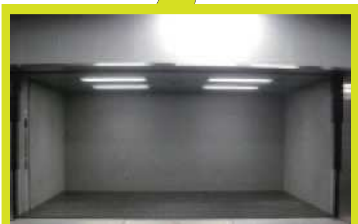
■リフター (搬入出用大型エレベーター)