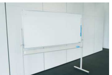
ホワイトボード(両面)