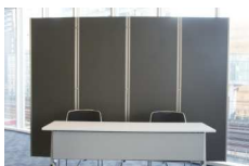
パネルパーテーション