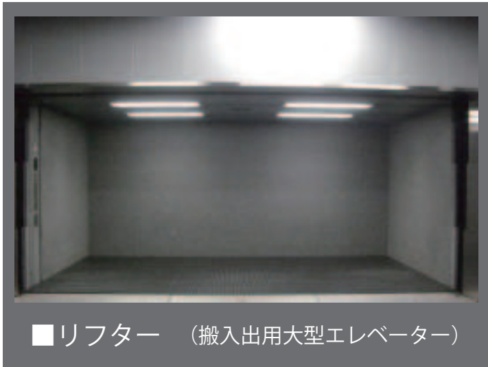
■リフター (搬入出用大型エレベーター)